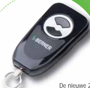
De nieuwe 2-kanaals handzender BHS121 unidirectioneel