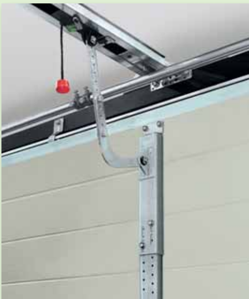
Inbouwconsole voor roldeuren (speciaal beslag)