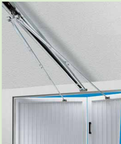
Speciaal beslag voor draaideuren (Let op: wanneer het automatische deurslot gewenst wordt, bestelt u dan onze speciale rails voor draaideuren)