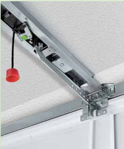
Universeel beslag voor kanteldeuren